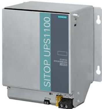
SITOP UPS1100/Mod. Batteria/24V/7AH

SITOP UPS1100 modulo batteria con batterie al piombo sigillate esenti da manutenzione per moduli SITOP DC-UPS DC 24 V 7 Ah