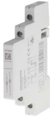
blocchetto di contatti ausiliari, gruppo semimodulo