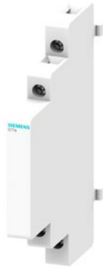
blocchetto di contatti ausiliari, centrale semimodulo