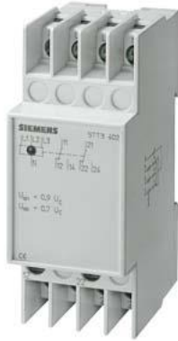
relè di tensione T5570 AC 230/400 V 2CO 0,85/0,95 con calotta trasparente