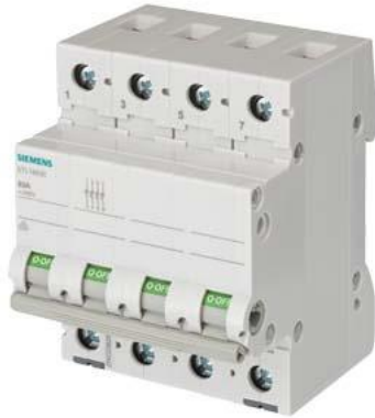
sezionatore sottocarico, interruttore ON/OFF 32 A a 4 poli