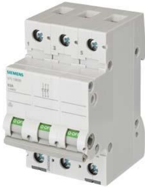
sezionatore sottocarico, interruttore ON/OFF 32 A a 3 poli