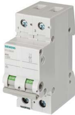
sezionatore sottocarico, interruttore ON/OFF 32 A a 2 poli