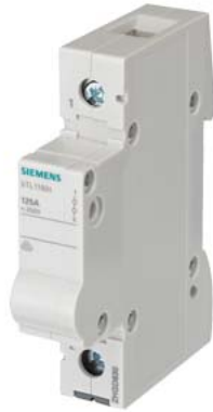
connettore di fase, grigio, a 1 polo