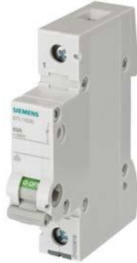
sezionatore sottocarico, interruttore ON/OFF 100 A a 1 polo