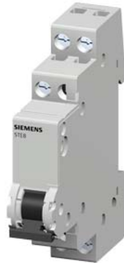
commutatore 20 A, 1CO