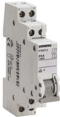
sezionatore sottocarico, interruttore ON/OFF 20 A 3NO