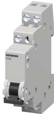
sezionatore sottocarico, interruttore ON/OFF 20 A 1NO