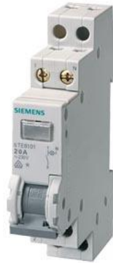
interruttore di controllo 20 A 3NO 1 lampada 230 V