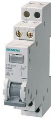
interruttore di controllo 20 A 2NO 1 lampada 230 V