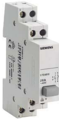
pulsante, 4NC 20 A, 1 pulsante grigio permanente