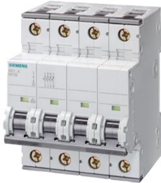
Interruttore magnetotermico 400V P=70mm 25 kA secondo EN 60947-2, 4P, C50