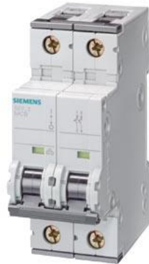
interruttore magnetotermico 230 V 15 kA, 1+a N poli, D, 2 A, P=70mm