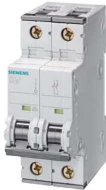
Interruttore magnetotermico 400V 15 kA, a 2 poli, C, 16A, P=70mm