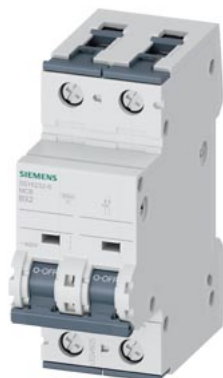
Interruttore magnetotermico 400V 6kA, a 2 poli, B, 32A, P=70mm