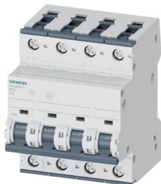
Interruttore magnetotermico 400V 10 kA, a 3+N poli, C, 8A, P=70mm