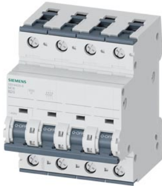
Interruttore magnetotermico 400V 10 kA, a 4 poli, B, 20A, P=70mm