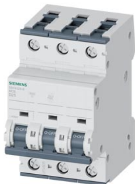
Interruttore magnetotermico 400V 10 kA, a 3 poli, D, 25A, P=70mm