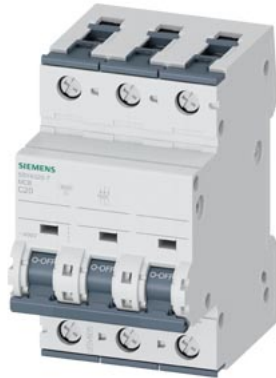
Interruttore magnetotermico 400V 10 kA, a 3 poli, C, 20A, P=70mm