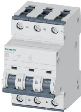
Interruttore magnetotermico 400V 10 kA, a 3 poli, B, 20A, P=70mm