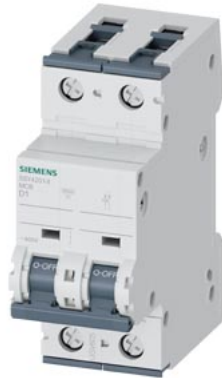
Interruttore magnetotermico 400V 10 kA, a 2 poli, D, 1A, P=70mm