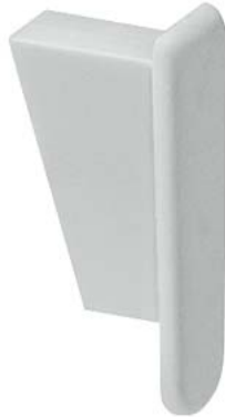
calotta terminale per sbarre di collegamento a punte monofase