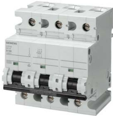
Interruttore magnetotermico 400V 10 kA, a 3 poli, B, 100A, P=70mm