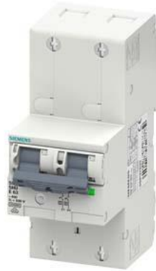
interruttore magnetotermico generale (SHU), a 2 poli, E 35, 400V