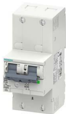
interruttore magnetotermico generale (SHU), a 2 poli, E 16, 400V