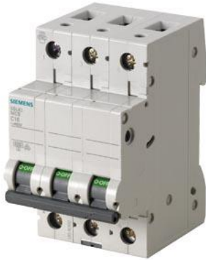
Interruttore magnetotermico 400V 6kA, a 3 poli C, 6A esecuzione Italia