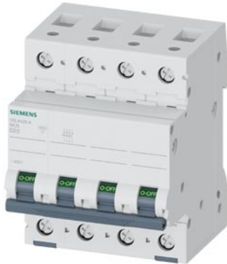
Interruttore magnetotermico 400V 10 kA, a 4 poli, D, 20A