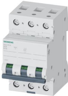
interruttore magnetotermico 400V 10kA, a 3 poli, D, 1,6A