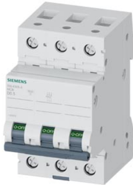
interruttore magnetotermico 400V 10kA, a 3 poli, D, 0,5A