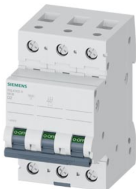
Interruttore magnetotermico 400V 10 kA, a 3 poli, D, 2 A