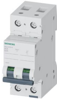
Interruttore magnetotermico 400V 10 kA, a 2 poli, D, 25A