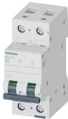
Interruttore magnetotermico 400V 10 kA, a 2 poli, D, 10A