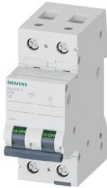
Interruttore magnetotermico 400V 10 kA, a 2 poli, D, 2 A