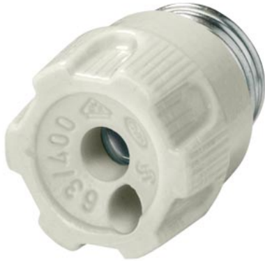
cappuccio filettato NEOZED porcellana grandezza D02, 63A con foro di prova