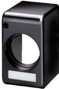
calotta in materiale isolante DIAZED DIII/63A E33