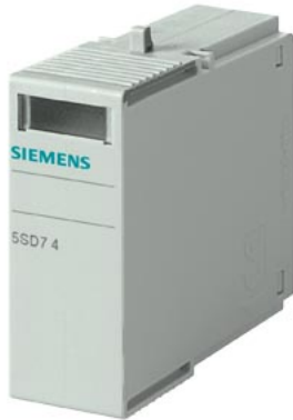
cartuccia estraibile per 5SD7481-1