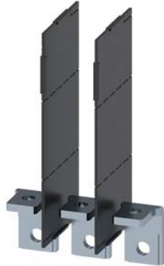
attacchi piatti a vite ad angolo retto, 3 pezzi accessori per: 3VA12