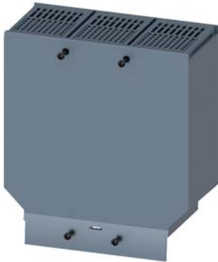
calotta coprimorsetti divaricata a 3 poli, 1 pezzo accessori per: 3VA12