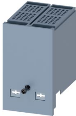
calotta coprimorsetti allungata a 2 poli, 1 pezzo accessori per: 3VA51