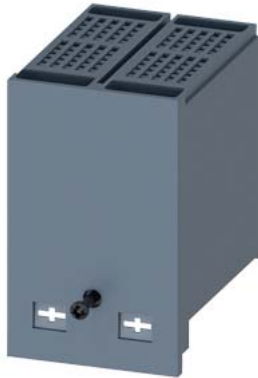
calotta coprimorsetti allungata a 2 poli, 1 pezzo accessori per: 3VA11