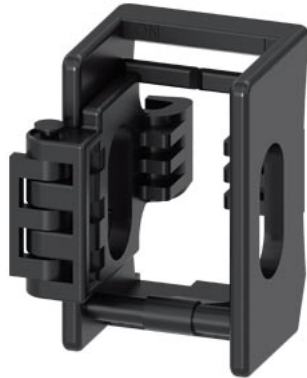
dispositivo di blocco per leva a bilanciere accessori per: 3VA51