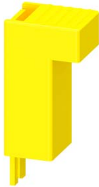
Control Kit per contattori 3RT2.3, 3RT2.4