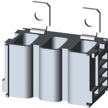
adattatore per fissaggio a vite