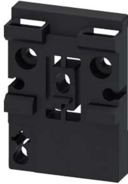
rondella distanziatrice per adattatore per guida DIN per 3RA2 (confezione multipla)