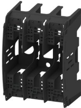
HRC Terminal cover for 3-pole plastic HRC fuse base Sz. 00 plastic