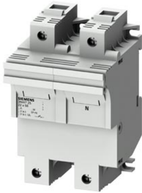
SENTRON, portafusibili per cartucce cilindriche, 22x58 mm, 1P+N, In: 100 A, Un AC: 690 V